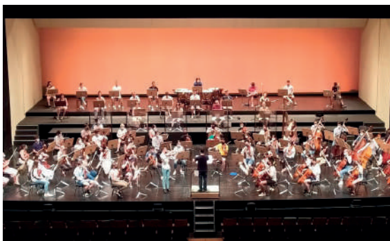
Ensayo OSC en Teatro de la Maestranza. Concierto Clausura US 20/21

E n 2011 la Universidad de Sevilla y el CSM Manuel Castillo pusieron en marcha un ambicioso proyecto académico y artístico con la creación de una orquesta sinfónica conjunta. Desde entonces, han sido diferentes los escenarios de Sevilla donde ha actuado, principalmente en el Auditorio de la ETS de Ingeniería de la US, pero también en el Teatro Lope de Vega, Teatro de la Maestranza, Patio de la Montería del Real Alcázar, Teatro Los Remedios, Auditorio de la ETS de Arquitectura de la US. Fuera de Sevilla capital, cabe destacar sus actuaciones en Cádiz, con motivo de las celebraciones del bicentenario de su Constitución, así como en Granada en el marco del proyecto Atalaya, Carmona, Fuentes de Andalucía, Mairena del Aljarafe o San José de la Rinconada.