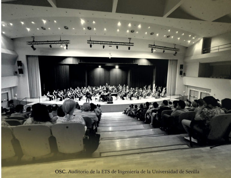
OSC. Auditorio de la ETS de Ingeniería de la Universidad de Sevilla