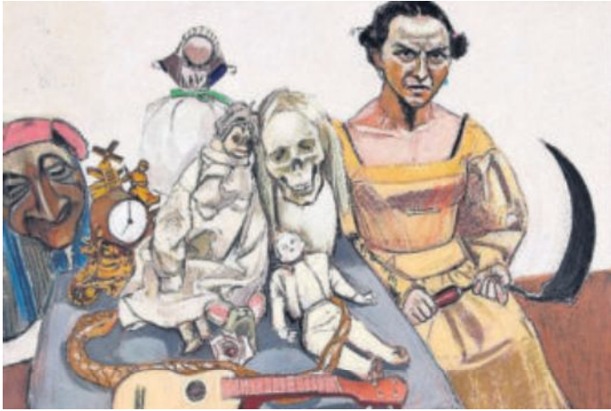
Detalle del tríptico Vanitas (2006).