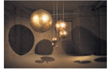
Vista de la exposición.

Schlosser tuvo ocasión de transmitir, en la desabrida España de los años setenta, la mirada sobre la naturaleza en unos momentos de tanta euforia como desorientación. Al decantarse por el empleo de materiales naturales, su obra se ha enjuiciado desde la estética del land art , mientras que el haber buscado en ellos la relación con formas geométricas puras ha supuesto que se le interprete como minimalista o conceptual , sin que esos calificativos cuadren con lo que Schlosser hacía realmente, que es enfrentar dialéctica y paradójicamente la construcción racionalista de la geometría a la irregularidad casual de los productos de la naturaleza. Javier Maderuelo