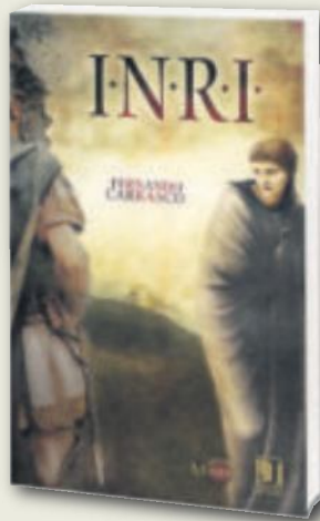
«INRI» Jirones de Azul. 799 páginas