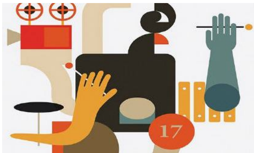
Detalle del cartel del 17º Festival de Jazz de la Universidad de Sevilla.