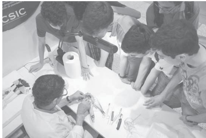
La Semana de la Ciencia, que se celebrará desde este jueves en Fibes, tiene un objetivo de difusión. CSIC

Los centros del CSIC ocuparán varios expositores en un mismo conjunto donde los in-