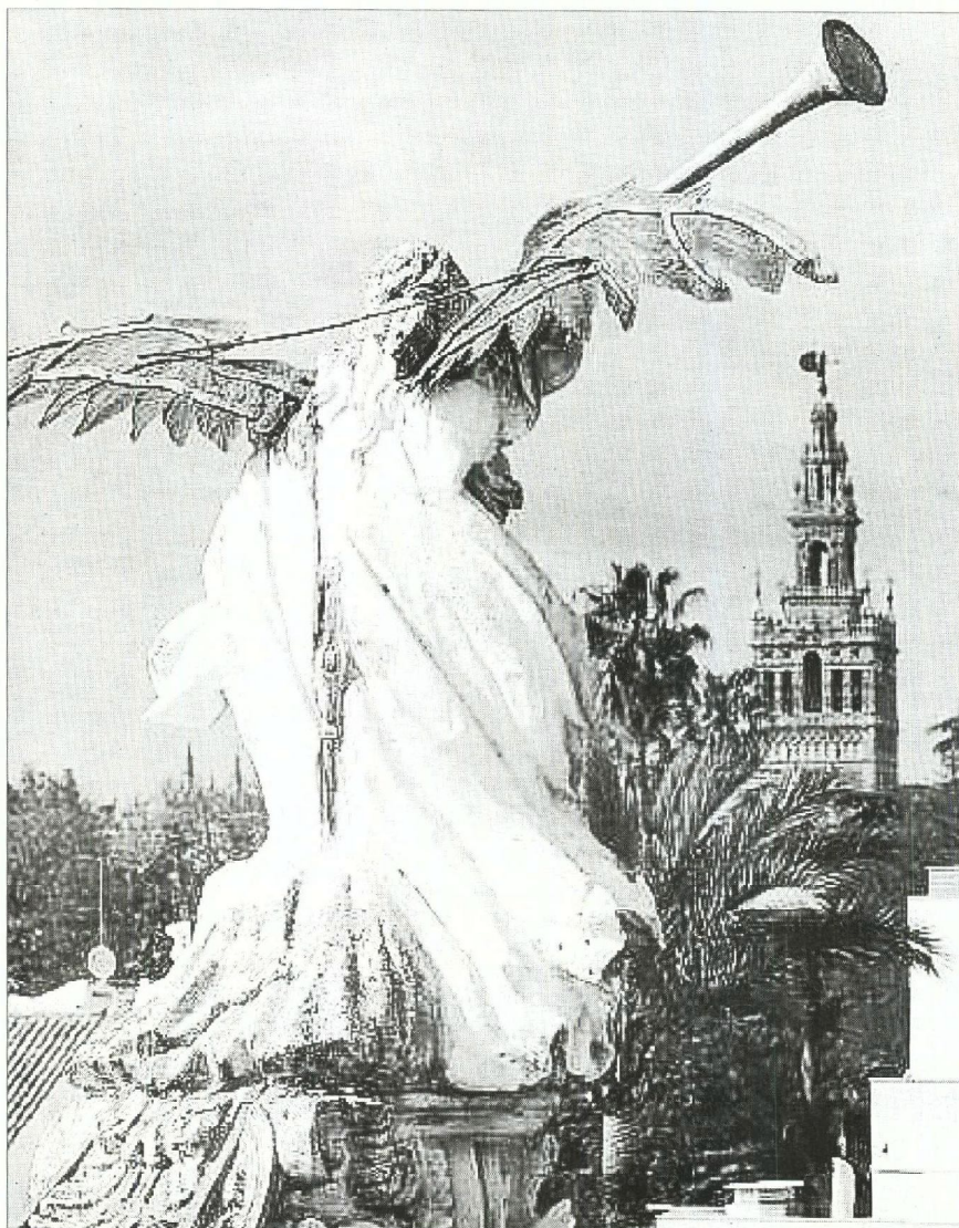
Vista trasera de la escultura de La Fama en las cubiertas de la antigua Fábrica de Tabacos, hoy sede del Rectorado.

La directora del Cicus también indicó que el próximo 19 de mayo se inaugurará la exposición Fábricas del conocimiento , que surge a iniciativa del Comité de Patrimonio de la Hispalense, y que está dedicada al patrimonio arquitectónico de la universidad. Para ello, se ha he-