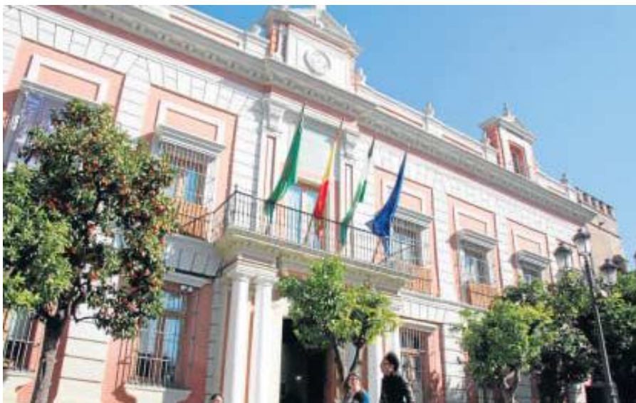
Fachada de la Casa de la Provincia, en la Plaza del Triunfo.

Una imagen de España. Fotógrafos estereoscopistas franceses (1856-1867), organizada junto a la Fundación Mapfre, Últimos sueños , que presentó en la Casa de la Provincia la colección de arte contemporáneo de La Caixa, Fernand Leger , el cubista afable y más recientemente la Obra Modular de Barbadillo (ambas con la Fundación Unicaja), o la exposición de retratos literarios de Daniel Mordzinski auspiciada por Caja