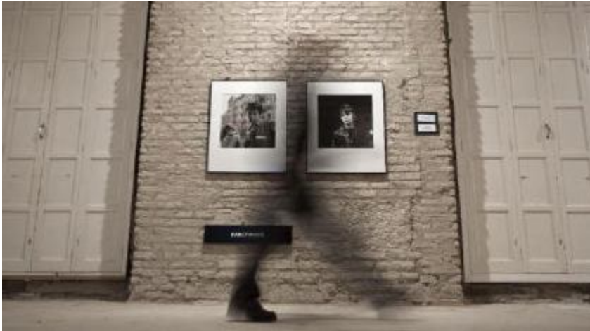
Larry Fink capta el alma contemporánea en blanco y negro en una antología en Sevilla Temas

Sevilla, 4 mar (EFE).- Celebrities de Hollywood , boxeadores aficionados, "beatniks" descalzos, "top models", músicos de jazz y proletarios obesos componen "Body and Soul", una antológica en la que el fotógrafo neoyorquino Larry Fink (1941) ha captado en blanco y negro el alma de Estados Unidos y de la sociedad actual.