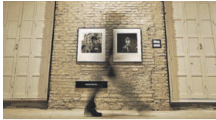
Un visitante pasa ante dos retratos.

Las imágenes cobran la fuerza de algunos de los personajes de sus retratos, como los de la serie "Boxing", imágenes tomadas en gimnasios de boxeadores aficionados de la ciudad de Philadelphia entre los años 1990 y 1994.