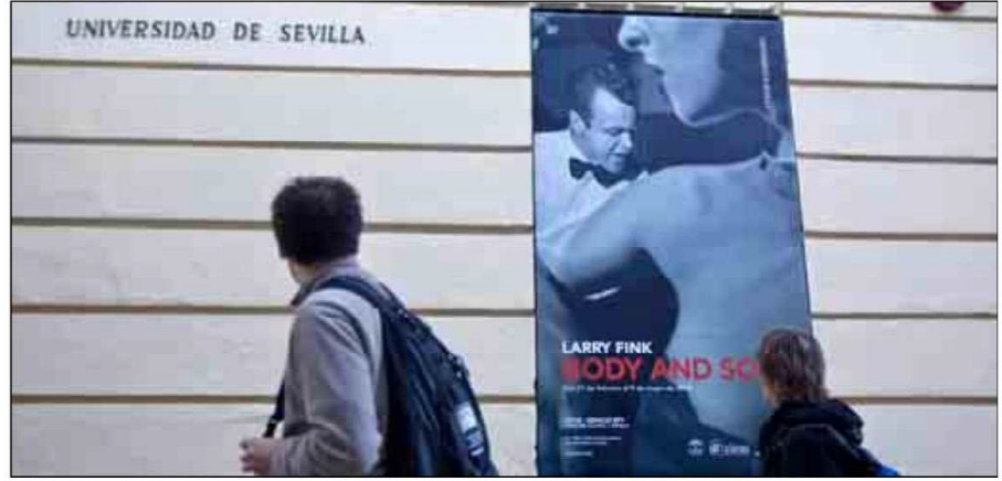
Unos jóvenes pasan ante el cartel anunciador de la exposición en la sede del Cicus.

Con un suelo de cemento y sobre unas paredes en las que no se ha recubierto el ladrillo de los muros, las imágenes de Body and Soul , también organizada por el Centro Andaluz de la Fotografía, cobran la fuerza de algunos de los personajes de sus retratos, como los de la serie Boxing , imágenes tomadas en gimnasios de boxeo-