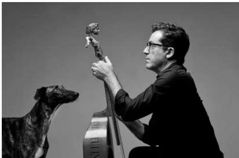
El intérprete valenciano es una referencia en la recuperación de música española anterior al XX.