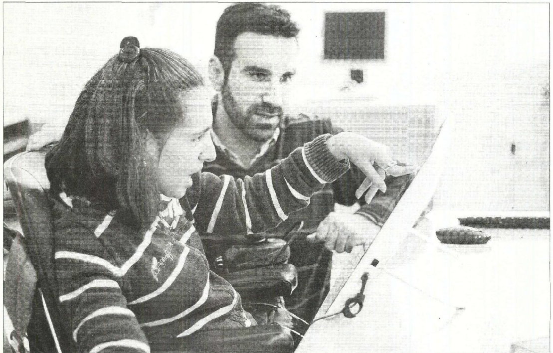
Una paciente con parálisis cerebral interactúa con una de las tabletas educativas Reedad ideadas por el TAIS de la Universidad de Sevilla.

Los afectados por parálisis cerebral poseen necesidades educativas especiales que pueden cubrirse con el empleo de